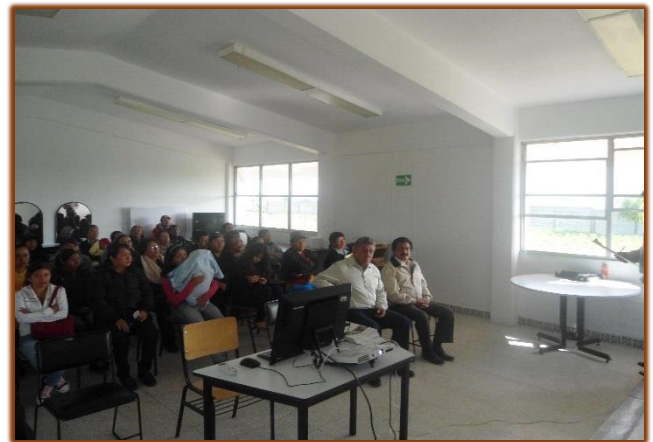
Academias de evaluación para especialidades con mayor demanda